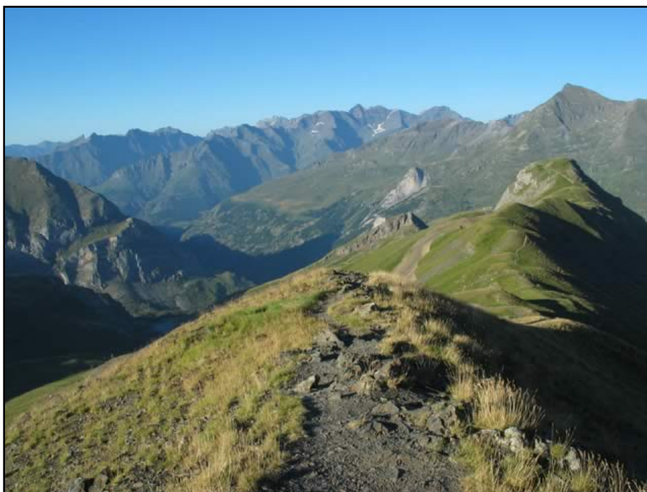
Pic de la Pahule depuis le pic de Tentes / Rokad

Lourdes - Luz Saint Sauveur - Gavarnie. Suivre la route qui monte à la station de ski de Gavarnie puis continuer la route jusqu'au col de Tentes.